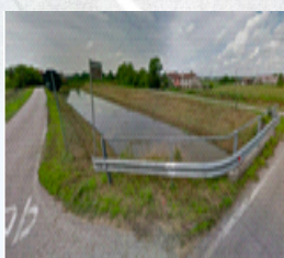
Ponte Via Bragadina