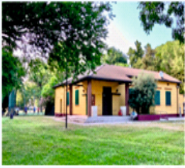
Partenza e Arrivo