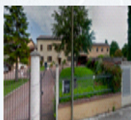
Agriturismo Le 3 Rondini