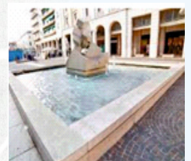
P.zza Garibaldi Il Sole Colom